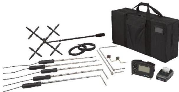
Модель 8715 (Микроманометр показан со стандартным и дополнительным оборудованием)

Расходомер потоков воздуха AssuBalance модели 8380 включает отсоединяемый микроманометр модели 8715 – один из наиболее совершенных, универсальных и легких в использовании микроманометров на рынке в настоящее время. Модель 8715 имеет автоматически обнуляемый сенсор давления, который увеличивает разрешение и точность измерений за счет иницилируемой структуры меню, которое придает легкость работе.